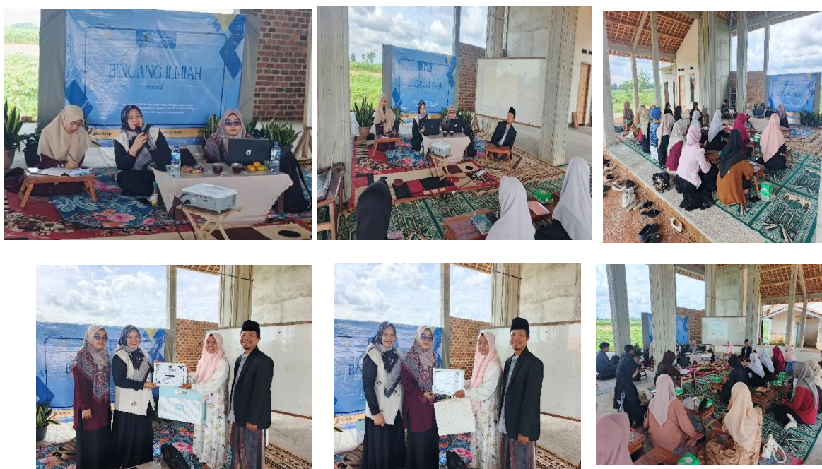
Gambar 1. Kegiatan Penguatan Literasi dan Digitalisasi Dakwah di Pesantren

Dokumentasi kegiatan pelaksanaan PkM baik metode ceramah maupun diskusi interkatif dapat dilihat pada gambar-gambar berikut: