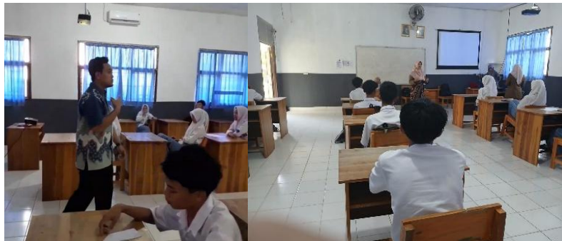
Gambar 3. Validasi dan Umpan Balik