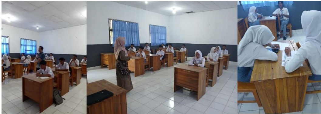
Gambar 1. Keterlibatan dan Antusiasme

ruang untuk validasi awal serta memberikan wawasan baru bagi siswa mengenai kekuatan dan kelemahan ide mereka. Beberapa ide mendapat tanggapan positif karena keunikannya, sementara yang lain mendapat saran pengembangan lebih lanjut. Umpan balik yang diterima menjadi motivasi bagi siswa untuk memperbaiki dan menyempurnakan rencana mereka.