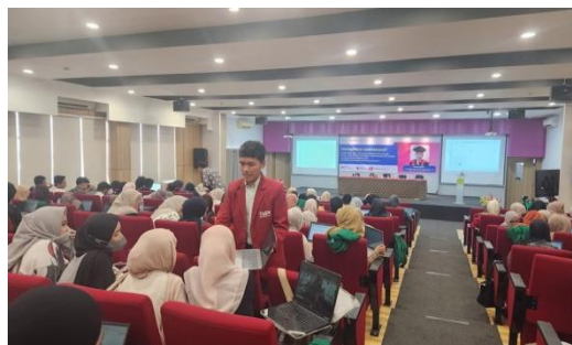
Gambar 4. Pelaksanaan Kegiatan Diskusi dan Pendampingan Peserta Kegiatan

Selama kegiatan berlangsung, peserta menunjukkan antusiasme yang tinggi, terutama pada sesi praktik dan diskusi. Hal ini terlihat dari aktifnya peserta dalam mengajukan pertanyaan, mendiskusikan permasalahan penelitian yang dihadapi, serta mencoba berbagai fitur analisis pada SPSS.