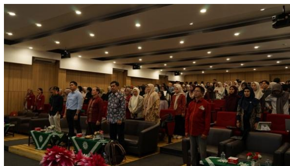
Gambar 2. Pembukaan Kegiatan

Pelaksanaan kegiatan diawali dengan registrasi peserta dan pembukaan kegiatan oleh panitia. Pada sesi pembukaan, dilakukan sambutan dari pihak Fakultas Ilmu Pendidikan UMJ sekaligus pembukaan resmi kegiatan workshop . Setelah pembukaan, peserta diberikan pretest untuk mengukur kemampuan awal peserta terkait pemahaman konsep statistik dasar, pengolahan data penelitian, serta penggunaan SPSS dalam penelitian pendidikan. Pretest dilakukan sebelum penyampaian materi sebagai bentuk pemetaan kemampuan awal peserta sehingga pelaksanaan workshop dapat disesuaikan dengan kebutuhan peserta.