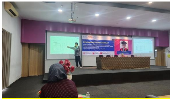
Gambar 3. Pemaparan Materi oleh Narasumber

penelitian pendidikan. Pada setiap sesi, narasumber tidak hanya menjelaskan konsep secara teoretis, tetapi juga memberikan demonstrasi penggunaan SPSS secara langsung sehingga peserta dapat mengikuti langkah-langkah analisis data secara praktik.