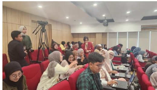
Gambar 5. Pemberian Posttest dan Angket Respons

keterampilan penggunaan SPSS untuk penelitian pendidikan.