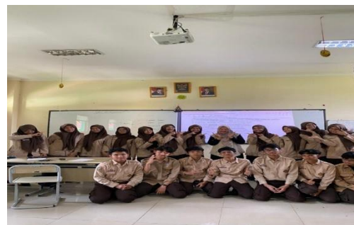
Gambar 2. Kegiatan PkM Penguatan TPA Bahasa Inggris Siswa Kelas X dan XI di Lingkungan MAN 23 Jakarta

Dalam sesi evaluasi, siswa menyatakan bahwa pelatihan membantu mereka memahami cara belajar bahasa Inggris secara lebih efektif. Mereka juga merasa lebih siap menghadapi tes akademik berbasis bahasa Inggris.