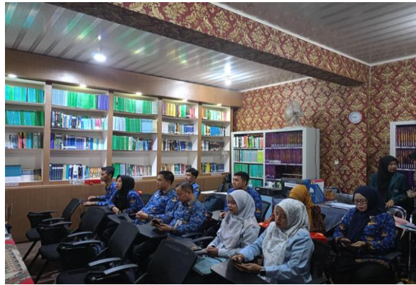
Gambar 2. Kegiatan Pretest

media 3D pada materi Sel. Pemberian pretest kepada peserta pelatihan disajikan oleh Gambar 2.