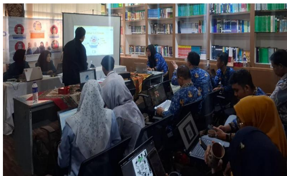
Gambar 3. Pemberian Materi Pelatihan oleh Narasumber

gambar yang diperlukan dan pemberian notasi atau keterangan gambar. (Gambar 3).