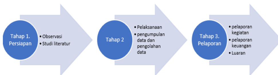
Gambar 1. Tahapan Kegiatan Pelatihan

Kegiatan pengabdian dilaksanakan dalam tiga tahapan, yaitu persiapan, pelaksanaan, dan pelaporan. Tahapan kegiatan secara ringkas dapat dilihat pada Gambar 1.